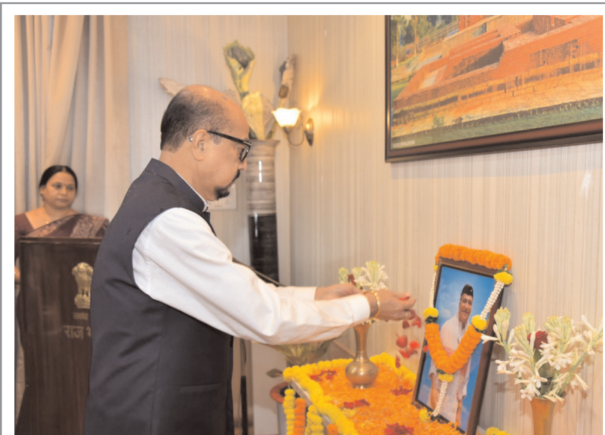
राज्यपाल रमन डेका ने आज राजभवन में प्रख्यात गायक, संगीतज्ञ एवं कवि, भारत रत्न डॉ. भूपेन हजारिका की शताब्दी जयंती पर उन्हें श्रद्धा सुमन अर्पित किए।

दिखाकर मतदाता, वोटर लिस्ट में अपना नाम शामिल कर सकते हैं। पहले इन दस्तावेजों में आधार कार्ड शामिल नहीं था, लेकिन अब सुप्रीम कोर्ट ने आधार कार्ड को बतौर 12वां दस्तावेज मानने का आदेश दिया है। शीर्ष अदालत ने चुनाव आयोग से अपने सभी अधिकारियों को निर्देश जारी करने को भी कहा है।