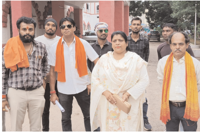
कार्यक्रम का आयोजन किया जा रहा है। करना हिन्दू समाज द्वारा कर्तई बर्दाश्त नहीं एक ऐसा व्यक्ति जिसकी आस्था सनातन किया जाएगा। पिछले वर्ष भी उक्त गरबा संस्कृति में नहीं है के द्वारा ऐसा आयोजन