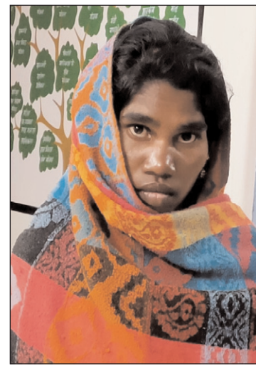
8 बजे ग्राम मोरगा से हुई पहचान पूरे दिन जिला विधिक सेवा प्राधिकरण की टीम