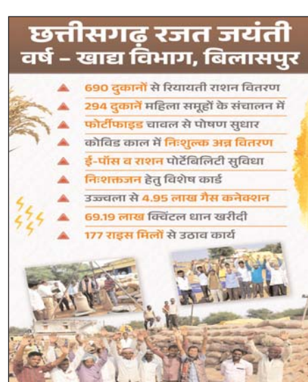
योजना। पात्र निःशक्तजनों को निःशुल्क खाद्यान्न प्रदाय

दी गई है, जो महिला सशक्तिकरण की दिशा में महत्वपूर्ण कदम है। कुपोषण उन्मूलन और पोषण सुधार - विभाग द्वारा फोर्टीफाइड चावल वितरण जैसी पहल के माध्यम से कुपोषण दर में कमी लाई गई है। इससे बच्चों और महिलाओं के स्वास्थ्य में सुधार आया है। कोविड-19 काल में जनसेवा - कोविड-19 संकट काल में विभाग ने घर-घर राशन वितरण की सुविधा उपलब्ध कराई। साथ ही प्रवासी मजदूरों और गैर-राशनकार्डधारियों को भी अन्न उपलब्ध कराया गया, और प्रधानमंत्री गरीब कल्याण अन्न योजना के अंतर्गत पात्र हितग्राहियों को निरंतर निःशुल्क खाद्यान्न प्रदान किया गया। डिजिटल प्रणाली और पारदर्शिता -ई-पांस मशीन आधारित ऑनलाइन वितरण, आधार प्रमाणीकरण, नामिनी और ओटीपी आधारित वितरण और राशन पोर्टेबिलिटी सुविधा दी जा रही है। इन सभी उपायों से विभाग ने वितरण प्रणाली में पारदर्शिता और सुलभता सुनिश्चित की है। निःशक्तजन और विशेष वर्ग - निःशक्तजन हितग्राहियों के लिए पृथक राशनकार्ड