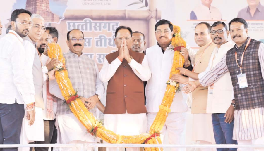
बेमेतरा। बेमेतरा जिले के ग्राम बांस तीर्थ संकल्पना सम्मलेन कार्यक्रम के तहत भारत का सबसे बड़ा और 140 फीट ऊँचा बम्बू टावर समर्पित छत्तीसगढ़ बांस तीर्थ संकल्पना समारोह का भव्य आयोजन हुआ। यह आयोजन न केवल बेमेतरा बल्कि पूरे छत्तीसगढ़ के लिए गौरव का विषय बना। इस भव्य समारोह में मुख्यमंत्री विष्णु देव साय, उपमुख्यमंत्री अरुण साव तथा कैबिनेट मंत्री दयालदास बघेल की विशेष उपस्थिति रही। मुख्यमंत्री विष्णु देव साय ने 140 फीट ऊँचे बम्बू टावर पर तिरंगा फहराते हुए कहा कि यह संरचना केवल बांस का निर्माण नहीं, बल्कि छत्तीसगढ़ की परंपरा, कौशल, नवाचार और व्यापक संभावनाओं का प्रतीक है। उन्होंने बांस का पौधा रोपण कर पर्यावरण संरक्षण तथा बांस आधारित कृषि के प्रसार की अपील की। मुख्यमंत्री ने समारोह स्थल पर स्थापित बांस उत्पाद निर्माण इकाइयों, फैक्ट्रियों और प्रोसेसिंग केंद्रों का अवलोकन किया तथा ग्रामीणों और कारीगरों से संवाद कर

भारत के सबसे ऊँचे 140 फीट बम्बू टावर पर मुख्यमंत्री ने किया ध्वजारोहण, बेमेतरा बना राष्ट्रीय आकर्षण का केंद्र