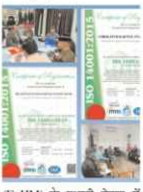
(EnHM) के प्रभावी नेतृत्व में संभव हुई है। यह प्रमाणन अत्यंत सघन एवं चुनौतीपूर्ण ऑडिट प्रक्रिया के उपरोक्त प्रदान किया गया, जिसमें स्टेशनों की स्वच्छता, अपशिष्ट प्रबंधन, जल संरक्षण, ऊर्जा दक्षता एवं पर्यावरण जागरूकता जैसे विभिन्न पहलुओं का गहन मूल्यांकन किया गया। इस अभियान के अंतर्गत बिलासपुर, चांपा, रायगढ़, कोरबा, अनूपपुर, पेंडुरोड, शहडोल, उमरिया एवं आंबिकापुर