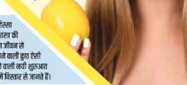
शुरुआत होगी या फिर आपको जीवन में शांति मिलेगी। यह इस बात की तरफ भी इशारा करता है कि आपके जीवन में जल्द सभी निगेटिव चीजें खत्म होंगी और पॉजिटिव बदलाव आएंगे।

दूसरे तरीके में नींबू को एक बर्तन में पानी भरकर उसमें डुबोकर फ्रिज में रखा। दो हफ्तों बाद इन नींबू पर