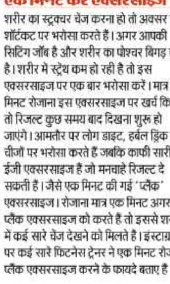
एक मिनट करें एक्सरसाइज

शरीर का स्ट्रक्चर चेज करना हो तो एक्सर सब शॉर्टकट पर भरोसा करते हैं। अगर आपकी शिटिंग जॉब है और शरीर का पोषण बिगाड़ चुका है। शरीर में स्ट्रेच कम हो रही है तो इस एक्सरसाइज पर एक बार भरोसा करें। मात्र एक मिनट रोजाना इस एक्सरसाइज पर खर्च किया तो रिजल्ट कुछ समय बाद दिखना शुरू हो जाएंगे। आमतौर पर लोग डाइट, हर्बल ड्रिंक जैसी चीजों पर भरोसा करते हैं जबकि काफी सारी ईजी एक्सरसाइज हैं जो मनचाहे रिजल्ट दे सकती हैं। जैसे एक मिनट की गई 'प्लैंक' एक्सरसाइज। रोजाना मात्र एक मिनट अगर आप प्लैंक एक्सरसाइज को करते हैं तो इससे शरीर में कई सारे रोज देखने को मिलते हैं। इंस्टाग्राम पर कई सारे फिटनेस ट्रेनर न एक मिनट रोजाना प्लैंक एक्सरसाइज करने के फायदे बताए हैं।