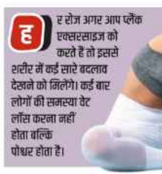
एक मिनट करें एक्सरसाइज

ह र रोज अगर आप प्लैंक एक्सरसाइज को करते हैं तो इससे शरीर में कई सारे बदलाव देखने को मिलेंगे। कई बार लोगों की समस्या वैट लॉस करना नहीं होता बल्कि पोषण होता है।