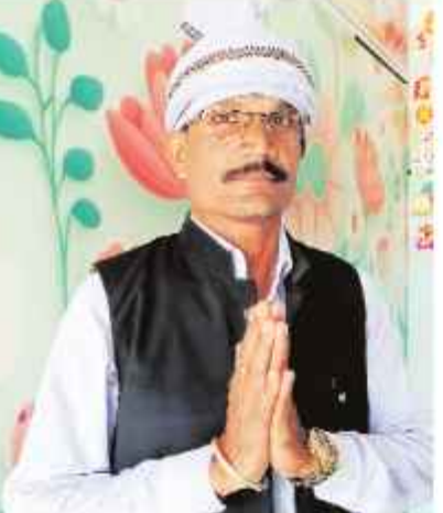
पुलिस की कार्यप्रणाली पर उठे सवाल