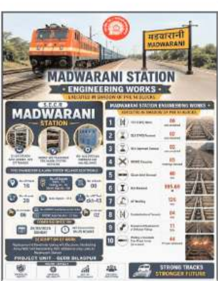
प्रबंधन के माध्यम से बिना किसी अतिरिक्त गाड़ी को प्रभावित किए सफलतापूर्वक पूरा किया गया। इससे

गया। कमीशनिंग कार्य के अंतर्गत स्टेशन पर आधुनिक इलेक्ट्रॉनिक इंटरलॉकिंग प्रणाली स्थापित की गई है। इसके साथ ही याई रीमॉडलिंग, अतिरिक्त लूप लाइन, सिग्नलिंग एवं सुरक्षा उपकरणों का उन्नयन किया गया। इस कार्य में आधुनिक तकनीकों एवं उन्नत सुरक्षा मानकों का उपयोग सुनिश्चित किया गया है। मड़वारानी स्टेशन पर किए गए प्रमुख कार्यों में 18 पॉइंट्स, 39 रूट, 11 मेन सिग्नल, 02 कॉलिंग-ऑन सिग्नल, 09 शंट सिग्नल, 06 लाइनें, 43 डीसी ट्रेक सर्किट, 06 ए-मार्कर, 02 एजी-मार्कर तथा रूब्रुष्ट आधारित आधुनिक ट्रेक सेक्शन एवं ऑटो सेक्शन की स्थापना शामिल है। लूप लाइन कमीशनिंग के अलावा इस रेलखंड के अन्य स्टेशनों में संपादित किए गए अनेक कार्य - अतिरिक्त लूप लाइन कमीशनिंग के दौरान रेलवे प्रशासन द्वारा संरक्षा से संबंधित अनेक महत्वपूर्ण इंजीनियरिंग कार्य भी एक साथ पूरे किए गए, जिन्हें सामान्य परिस्थितियों में अलग-अलग ब्लॉक लेकर तथा गाड़ियों को रद्द कर ही किया जा सकता था। विशेष बात यह रही कि इन सभी कार्यों को बेहतर योजना, समन्वय एवं