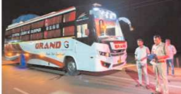
निरंतर चलाया जा रहा है। विभाग का मानना है कि सुरक्षित परिवहन व्यवस्था के लिए नियमों का पालन आवश्यक है। चेकपोस्ट क्षेत्र में पूर्व में भारी एवं व्यावसायिक वाहनों को तेज गति से आजाजाही के कारण दुर्घटनाओं की घटनाएं सामने आती थीं, जिससे कई लोग घायल हुए थे। इस समस्या के समाधान हेतु परिवहन विभाग द्वारा चेकपोस्ट के दोनों प्रवेश द्वारों पर बैरिकेड्स लगाए गए, जिससे वाहनों की गति नियंत्रित हुई। इस प्रभावी पहल का परिणाम यह रहा कि पिछले आठ माह के दौरान चेकपोस्ट क्षेत्र में कोई भी सड़क दुर्घटना दर्ज नहीं हुई, जो विभाग की सतर्कता और

सरायपाली। छत्तीसगढ़ परिवहन विभाग द्वारा संचालित परिवहन जांच चौकी खम्हारपाली में यात्री सुरक्षा, सड़क सुरक्षा एवं राजस्व संग्रहण को ध्यान में रखते हुए लगातार सघन जांच अभियान चलाया जा रहा है। खम्हारपाली परिवहन जांच चौकी प्रभारी ठाकुर के नेतृत्व में छत्तीसगढ़ से ओडिशा एवं झारखंड की ओर संचालित अखिल भारतीय पर्यटक पर्यटन एवं अन्य व्यावसायिक बसों की नियमित जांच की जा रही है। जांच के दौरान कई बसों में निर्धारित सीमा से अधिक लगेज का परिवहन पाया गया, जिस पर नियमानुसार कार्रवाई की गई। मई माह में ही 15 बसों सहित अन्य वाहनों पर कार्रवाई करते हुए लगभग 2 लाख रुपये का शमन शुल्क वसूला गया। साथ ही वाहन संचालकों को भविष्य में नियमों का पालन करने एवं निर्धारित सीमा से अधिक सामान का परिवहन नहीं करने की सख्त चेतावनी दी गई है। परिवहन विभाग द्वारा यात्रियों को सुरक्षा को सर्वोच्च प्राथमिकता देते हुए सड़क सुरक्षा एवं यातायात नियमों के प्रति जनजागरूकता अभियान भी