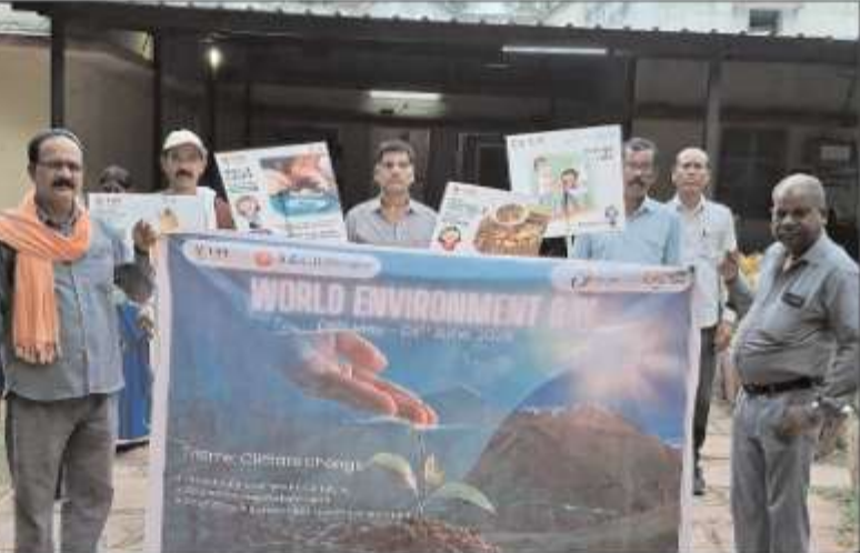
ऊर्जा संरक्षण जागरूकता अभियान चलाया गया। कर्मचारियों को लाइटों, पंखों, कंप्यूटरों एवं अन्य विद्युत उपकरणों को उपयोग न होने की स्थिति में बंद रखने, एलईडी प्रकाश व्यवस्था के उपयोग को बढ़ावा देने तथा एयर कंडीशनरों का निर्धारित तापमान पर दक्षतापूर्वक उपयोग करने

बिलासपुर। दक्षिण पूर्व मध्य रेलवे के बिलासपुर मंडल द्वारा विश्व पर्यावरण दिवस अभियान-2026 (15 मई से 5 जून 2026) के अंतर्गत पर्यावरण संरक्षण, स्वच्छता एवं सतत विकास को प्रोत्साहित करने हेतु विविध जन-जागरूकता कार्यक्रमों का आयोजन निरंतर किया जा रहा है। इसी क्रम में 02 एवं 03 जून 2026 को जल एवं ऊर्जा संरक्षण विषय पर विशेष अभियान संचालित किया गया। अभियान के दौरान मंडल के सभी स्टेशनों, कार्यालयों एवं रेलवे परिसरों में यात्रियों, कर्मचारियों तथा आम नागरिकों को जल संरक्षण एवं स्वच्छता के महत्व के प्रति जागरूक किया गया। विभिन्न स्थानों पर पोस्टर, बैनर, जनघोषणाओं एवं संवाद कार्यक्रमों के माध्यम से जल स्रोतों को स्वच्छ बनाए रखने, जल की बर्बादी रोकने तथा जल संरक्षण को दैनिक जीवन का हिस्सा बनाने का संदेश दिया गया। साथ ही स्टेशन परिसरों एवं आसपास के क्षेत्रों में विशेष स्वच्छता अभियान चलाकर बेहतर साफ-सफाई सुनिश्चित की गई। ऊर्जा संरक्षण को बढ़ावा देने के उद्देश्य से मंडल के सभी स्टेशनों एवं कार्यालयों में