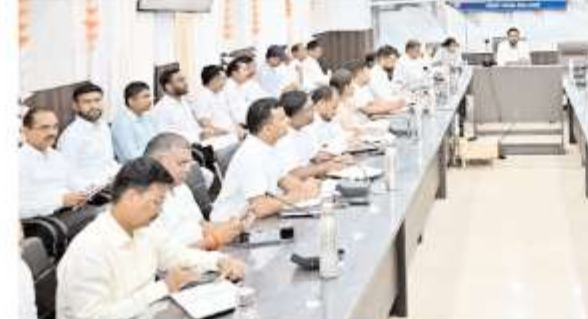
विकासखंड स्तर पर नामांकित अधिकारियों का प्रशिक्षण कार्यक्रम 2 जून 2026 को प्रातः 10.30 बजे से जिला पंचायत धमतरी के सभाकक्ष में आयोजित किया जाएगा। उन्होंने बताया कि जिले के सभी विभागों के नामांकित जिला स्तरीय अधिकारी प्रशिक्षण में भाग लेना आवश्यक है। विकासखंड धमतरी के अधिकारी जिला पंचायत सभाकक्ष में प्रशिक्षण प्राप्त करेंगे, जबकि नगरी, कुरुद एवं मगरलौड विकासखंडों के अधिकारी अपने-अपने मुख्यालयों से वीडियो को-ऑरिडिंग के माध्यम से प्रशिक्षण में शामिल होंगे। कृषि विभाग की समीक्षा के दौरान कलेक्टर ने जिले में खाद के भंडारण, उठाव एवं वितरण की अद्यतन स्थिति की जानकारी ली तथा अधिकारियों को निरंतर