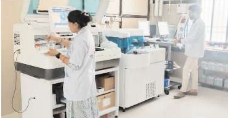
प्रक्रिया भी अधिक त्वरित और प्रभावी बन सकेगी। मालूम हो कि मुख्यमंत्री विष्णुदेव साय द्वारा विगत 13 अप्रैल को सुकमा जिले से राज्यव्यापी स्तर पर शुभारंभ की गई है। इस योजना का उद्देश्य उच्च स्तरीय डायग्नोस्टिक सेवाओं का विकेंद्रीकरण कर उन्हें प्रदेश के अंतिम छोर तक पहुंचाना है। योजना के प्रभावी क्रियान्वयन हेतु छत्तीसगढ़ स्वास्थ्य विभाग द्वारा भारत सरकार के स्वास्थ्य एवं परिवार कल्याण मंत्रालय के अधीन मिनी रब सार्वजनिक उपक्रम एचएलएल लाइफकेयर लिमिटेड के साथ सार्वजनिक निजी सहभागिता मॉडल के अंतर्गत साझेदारी की गई है। एचएलएल की विशेषीकृत स्वास्थ्य सेवा इकाई हिंदुस्तान द्वारा इन सेवाओं का संचालन किया जा रहा है। अटल आरोग्य लैब योजना के तहत प्रदेशभर के 1,046 शासकीय

धमतरी। छत्तीसगढ़ शासन द्वारा प्रदेशवासियों को गुणवत्तापूर्ण, सुलभ एवं निःशुल्क स्वास्थ्य सेवाएं उपलब्ध कराने की दिशा में एक महत्वपूर्ण पहल करते हुए महत्वाकांक्षी अटल आरोग्य लैब योजना के अंतर्गत जिला अस्पताल धमतरी में अत्याधुनिक प्रयोगशाला सेवाओं का संचालन प्रारंभ कर दिया गया है। इस पहल से जिले के नागरिकों को आधुनिक तकनीक आधारित जांच सुविधाएं स्थानीय स्तर पर उपलब्ध होंगी तथा बेहतर स्वास्थ्य सेवाओं तक उनकी पहुंच और अधिक सुदृढ़ होगी। जिला धमतरी में वर्तमान चरण में 94 प्रकार की जांच सेवाएं प्रारंभ की गई हैं। इनमें सीरोलाजी, हीमेटोलॉजी, इम्यूनोएसे, हामोन एनालाइजर, इलेक्ट्रोलाइट एनालाइजर, क्लॉनिकल पैथोलॉजी सहित अनेक विशेष जांचें शामिल हैं। आगामी चरणों में जांच सुविधाओं का और विस्तार किया जाएगा, जिससे जिले के नागरिकों को और अधिक व्यापक स्वास्थ्य सेवाओं का लाभ मिल सकेगा। योजना की एक महत्वपूर्ण विशेषता यह है कि मरीजों को जांच रिपोर्ट प्राप्त करने के लिए अस्पताल अथवा प्रयोगशाला के बार-बार चक्र लगाने की आवश्यकता नहीं होगी। जांच पूर्ण होने के उपरान्त रिपोर्ट सीधे उनके मोबाइल फोन पर एसएमएस एवं व्हाट्सएप के माध्यम से उपलब्ध कराई जाएगी। इससे न केवल समय की बचत होगी, बल्कि चिकित्सकीय परामर्श एवं उपचार