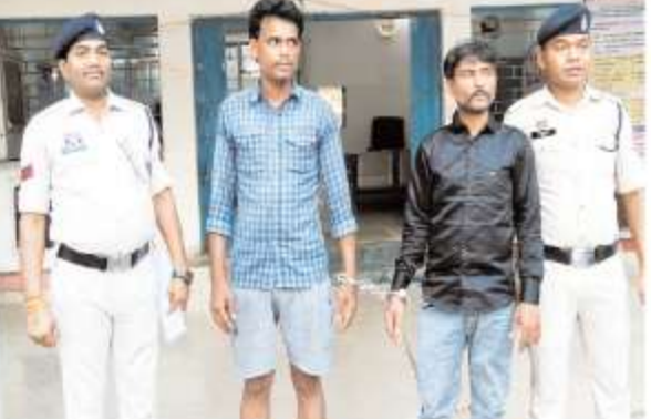
हुआ था। प्रार्थी की रिपोर्ट पर थाना भाटापारा शहर में अपराध क्र. 172/2025 घारा 305ए, 331(4) बीएनएस का प्रकरण दर्ज कर विवेचना में लिया गया। प्रकरण में थाना भाटापारा शहर पुलिस द्वारा मामले की बारीकी से जांच की जा रही थी। जांच के दौरान पता चला कि पीछले के मोहल्ले (सुभाष वार्ड) में ही किराए के मकान में रहने वाले दो सदिग्ध युवक घटना के बाद से गायब हैं। पुलिस टीम द्वारा मुखबिर तंत्र और तकनीकी साक्ष्यों की मदद से आरोपियों का पीछा किया गया, जिसके बाद दोनों शक्ति आरोपियों को बिलासपुर से घेराबंदी कर हिरासत में लिया गया। इस दौरान दोनों आरोपी चोरी का सामान सोने चांदी की जेवर आदि बेचने की फिराक में बिलासपुर में घूम रहे थे। कड़ी पूछताछ में आरोपियों ने अपना जुर्म कबूल कर लिया है। प्रकरण में थाना भाटापारा शहर पुलिस ने आरोपियों के कब्जे से चोरी का शत-प्रतिशत मशरूका बरामद करने में सफलता पाई है।