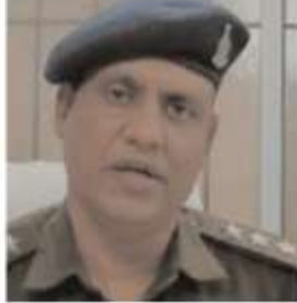
अपराधियों पर शिकंजा कसा था। नशे के कारोबार, जुए-सट्टे और अन्य गैरकानूनी गतिविधियों पर उनकी सख्ती को चर्चा पूरे क्षेत्र में रही थी। यही कारण है कि उनकी पुनः पदस्थापना को कानून व्यवस्था के लिए सकारात्मक माना जा रहा है। क्षेत्रवासियों का मानना है कि उनके नेतृत्व में रतनपुर में कानून का राज और मजबूत होगा तथा अपराधियों पर प्रभावी नियंत्रण स्थापित होगा। वहीं दूसरी ओर अवैध कारोबार से जुड़े लोगों में उनकी वापसी को लेकर बेचैनी देखी जा रही है।

■ सख्त पुलिसिंग के लिए प्रसिद्ध निरीक्षक ने संभाली कमान, कानून व्यवस्था को लेकर बड़ी जनता की उम्मीदें