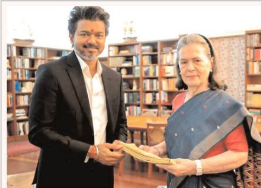
तमिलनाडु के मुख्यमंत्री सी. जोसेफ विजय ने नई दिल्ली में 10 जनपथ पर कांग्रेस संसदीय दल की अध्यक्ष सोनिया गांधी से मुलाकात की।

पुथल और राजनीतिक अटकलों के बीच एक विस्तृत बयान जारी किया है। उन्होंने कहा कि मीडिया लगातार उनसे यह पूछ रहा है कि वे किस खेमे में हैं, जिससे वे थक चुके हैं। सुप्रियो ने स्पष्ट किया कि वह पूरी तरह उस पार्टी और नेतृत्व के साथ खड़े हैं।