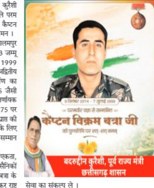
सेवा का संकल्प ले ।